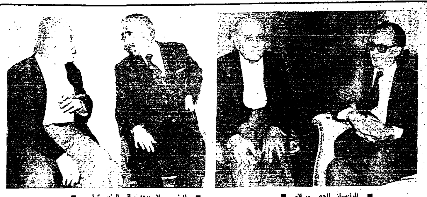
الرئيس سلام يتحدث إلى الرئيس كرامي

الرئيس الأسد سجدت إلى الشيخ: بعد الحظف تاسم - ويبدو إلى اليسار من العلماء الرئيس الأسد سجدت إلى الشيخ: بعد الحظف تاسم - ويبدو إلى اليسار من العلماء الرئيس الأسد سجدت إلى الشيخ: بعد الحظف تاسم - ويبدو إلى اليسار من العلماء